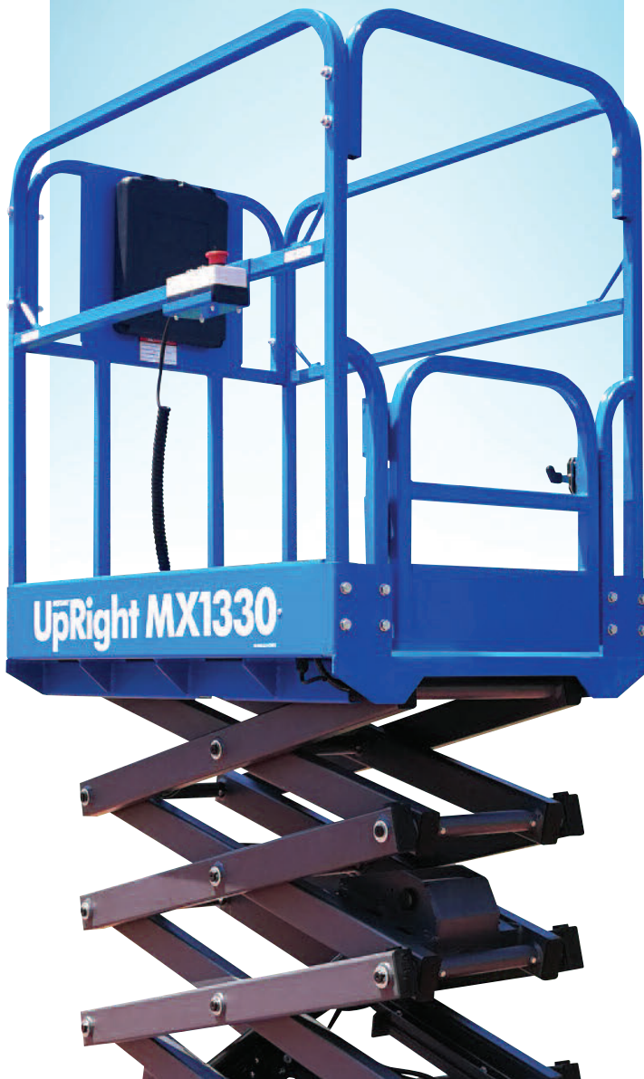
PLATE-FORME ÉLÉVATRICE À CISEAUX MOBILE

La plate-forme élévatrice à ciseaux mobile MX1330 est un véritable dispositif multitâche. Compacte et légère, elle passe par une seule porte, rentre dans un ascenseur et offre des hauteurs de travail pouvant atteindre 6 m.