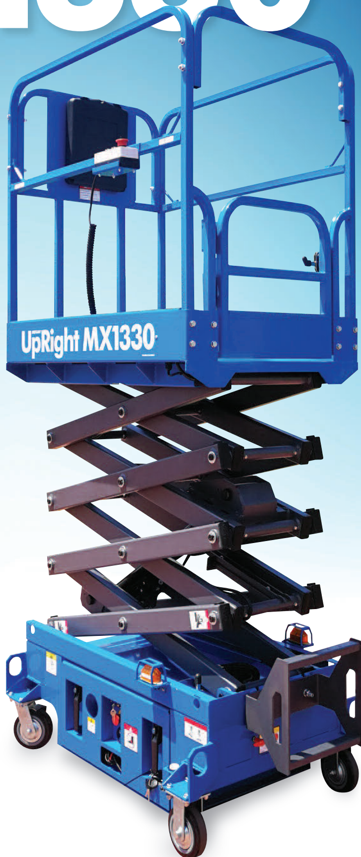
PLATE-FORME ÉLÉVATRICE À CISEAUX MOBILE